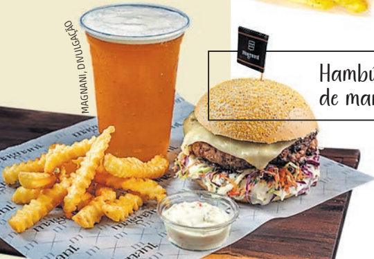
Hambúrguer de marreco