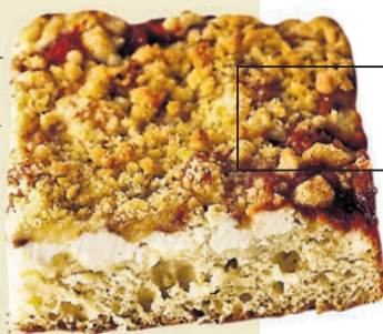
Cuca de farofa